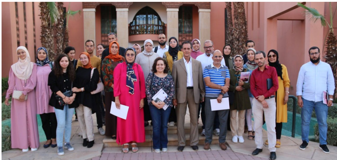
2nd session of nurse educational program 24-25 December 2022 in French Marrakesh, Morocco