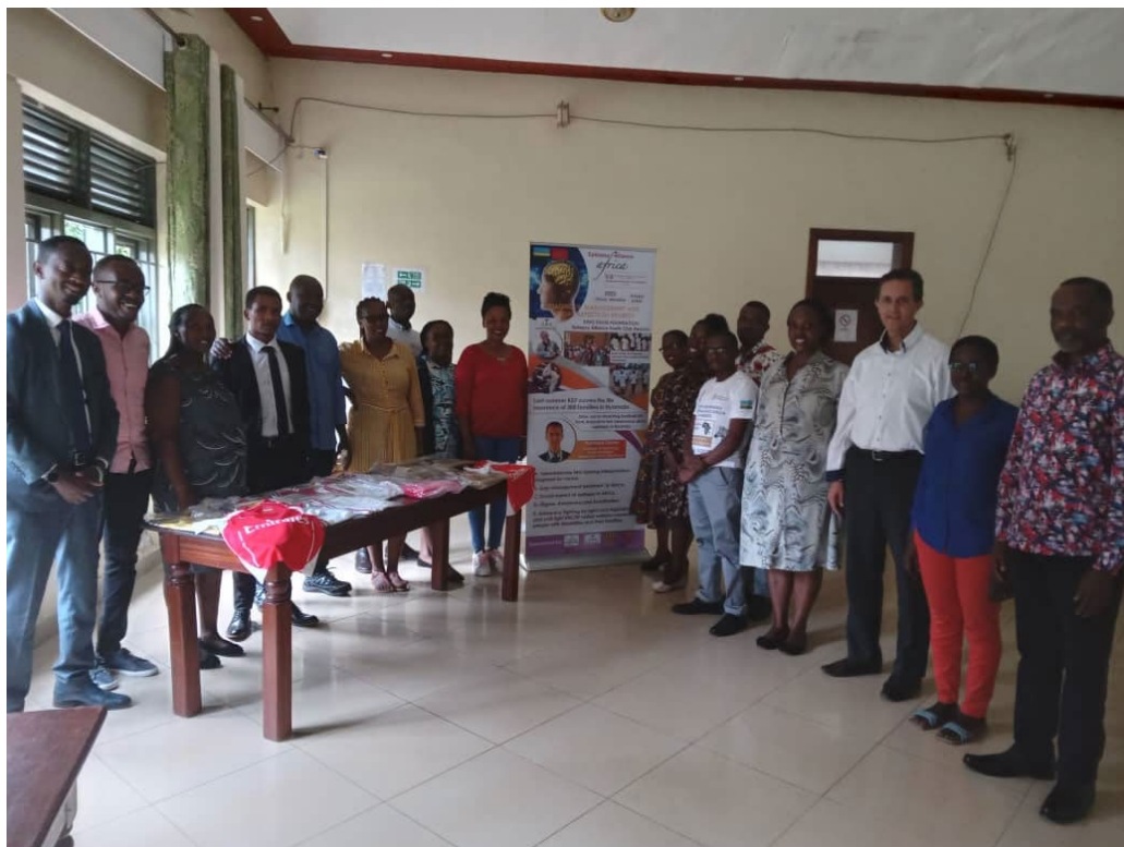
General practitioners and pediatrician 1st education program 1-2 October 2022 in Marrakech, Center Morocco