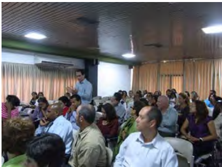
Discusión de casos clínicos.