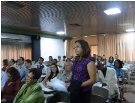
Debate en torno a la presentación de casos clínicos