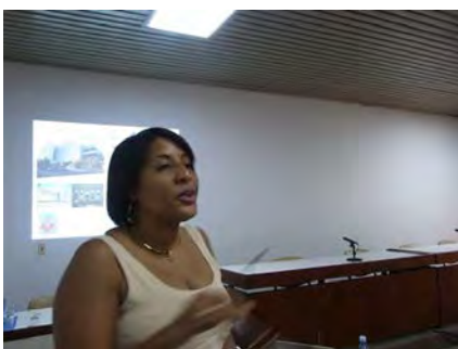
Comienzo de la sesión del segundo día III Curso-Taller ALADE, Habana Cuba 4 marzo 2014