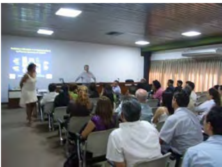
Discusión de casos clínicos.