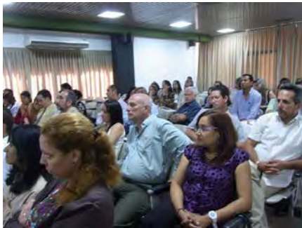
Audiencia en el segundo día del curso durante la presentación y discusión de casos clínicos.