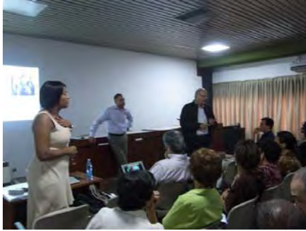
Discusión de casos clínicos.