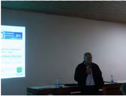
Ponencia Cirugía de Epilepsias en edad pediátrica