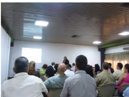
Participación en el segundo día del Curso Taller