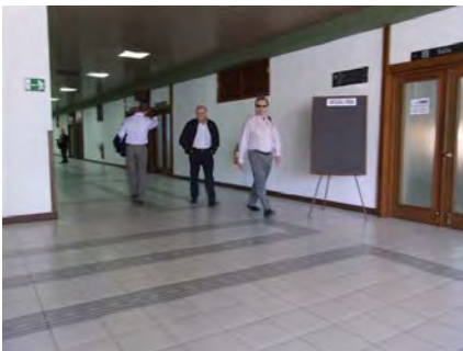
Profesores invitados arriivando a las sesiones del III Curso-Taller ALADE, Habana Cuba 4 marzo 2014