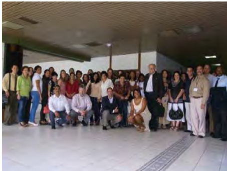
Clausura del III Curso-Taller